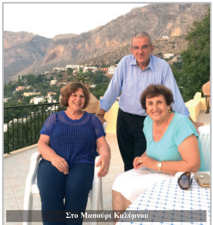
Στο Μασούρι Καλύμνου